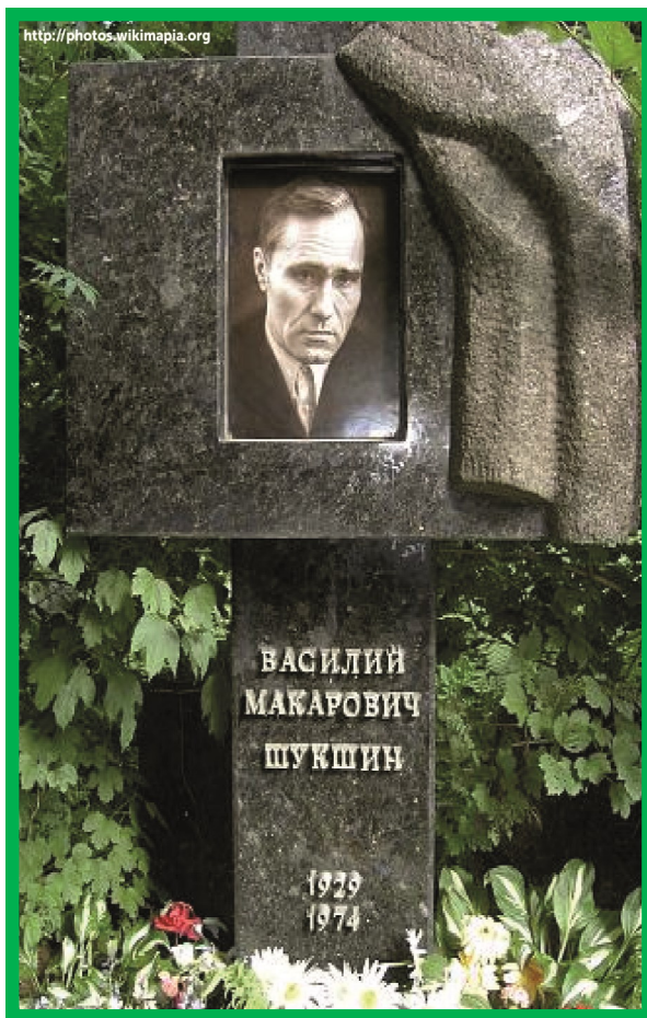
Памятник на Новодевичьем кладбище

Васи́лий Мака́рович Шук- ши́н (25 июля 1929, се- ло Сростки, Бийский рай- он, Сибирский край —