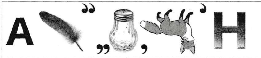
▲ Ребус «Апельсин»

ВЕДУЩАЯ: Царь рассылал клубни по всей России вместе с наставлениями по их выращиванию. Однако посадочный материал замерзал, становился несъедобным. По неведению, что молодые клубни и плоды ядовиты, люди получали отравления. Конечно, так было лишь поначалу! В 1758 г. появилась научная статья «О разведении земляных яблок». Позже, при императрице Екатерине II, удалось повсеместно распространить эту культуру. А теперь мы уже не представляем своей жизни без картофеля!